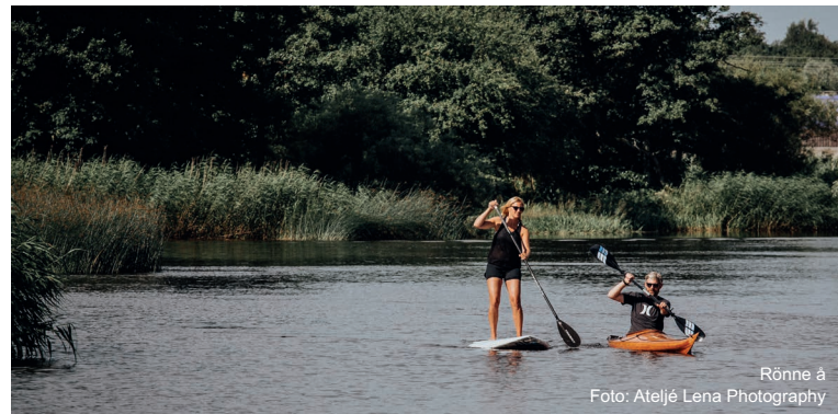
Rönne å